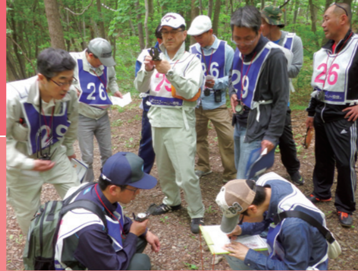
「チーム・イノベーション・キャンプ」研修

「自ら手を挙げチャレンジする」という組織風土を醸成させるためのさまざまな取り組みを実施しています。中でも「新しい働き方実現プロジェクト」では、従業員自らが職場環境や働き方について協議を積み重ね、サテライトオフィスの設置や会議の効率化等の取り組みが始まり、全社に展開していく予定です。2017年度はBXグループ全社で「働き方の改革」を推進し、多様な人材がさらに活躍できる職場づくりを進めていきます。