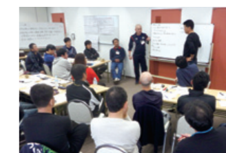
チーム・イノベーション・キャンプ

各リーダーが自己の行動特性を把握した上で自部門における使命・価値観を追求し、組織におけるイノベーション・プラン策定、実践に活かすことが目的の研修です。