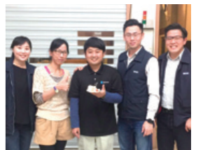
BX BUNKA TAIWAN 輸出貿易班のメンバーと

初の海外が長期生活になるという ことで、当初は不安でいっぱい でしたが、この貴重な機会を無駄に すまいと、積極的にコミュニケーション を図ろうと努力を続けたこと で、台湾人スタッフと共に毎日、 有意義な研修を送ることができま した。長期間にわたり異文化に触 れ続けた経験を、これからの日本 での社会人生活の向上につなげ ていきたいと思っています。